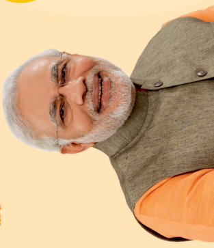
श्री नरेन्द्र मोदी, प्रधानमंत्री